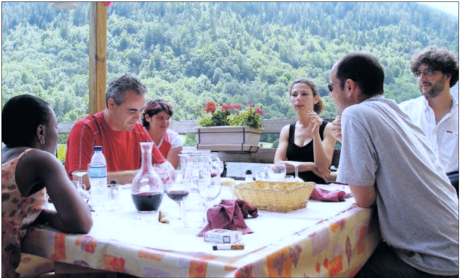
Grâce au TGV et à Internet, le télétravail permet de remplacer les embouteillages et les réunions sans fin par plus de convivialité en famille et au village. DR.